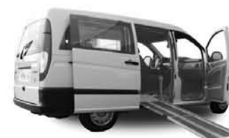
Elevações de Tecto Rampas Manuais